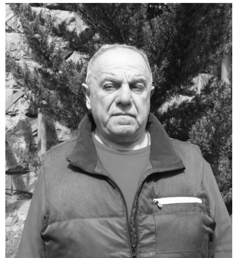
Եվ բոլորս միասին, վարչապետի նշած հավաստիացումից հետո, կծգտենք վերականգնել Կապանի ֆուտբոլային համբավը: Ու ստիպված չենք լինի նորից փակել Կապանով անցնող միջպետական ճանապարհը կամ շրջափակել Արծվանիկի պղծամբարը...

Փա՛ռք Աստծո, որ մարզպետը հիմա սյունեցի է: Սպասում ենք, որ Կապանի համայնքապետն էլ մի նորմալ անձնավորություն կլինի: